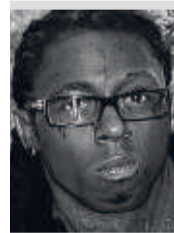
Lil Wayne vraagt 30 dollar voor een shirt met het opschrift 'Free Weezy' (zijn bijnaam)